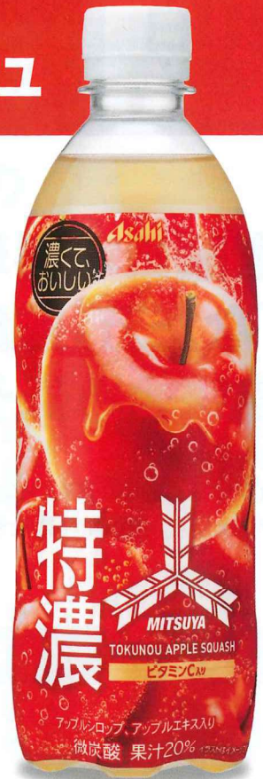
三ツ矢特濃アップルスカッシュ PET500ml

果汁 製法 香り 水 果汁を使用し、果実のおいしさにこだわります。 熱を抑えることで、果実のさわやかな味わいが引き立ちます。 果実などから集めた香りにより独自のおいしさがあります。 ろ過を重ねた安心・安全な水を使っています。 保存料を一切使っておりません。