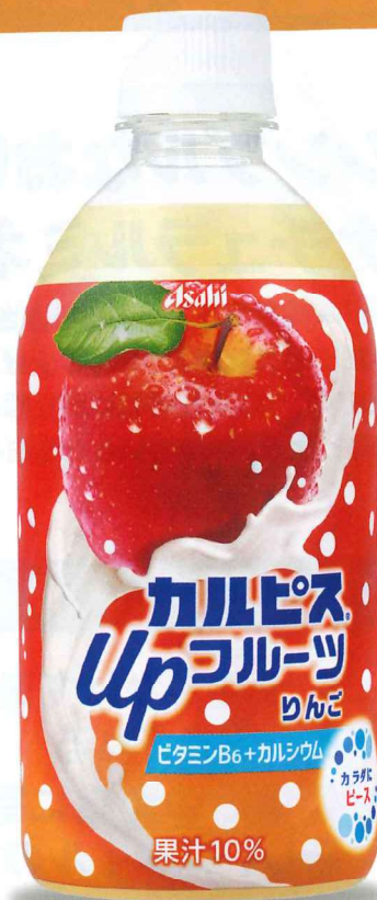
「カルピス® Upフルーツ りんご」 PET470ml

カルピス®がりんごのおいしいところを引き上げた果汁飲料です。 また不足しがちなビタミンB 6 に加えて、カルシウムも入った カルピス®ならではの果汁飲料です。