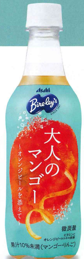
バヤリース大人のマンゴー ~オレンジピールを添えて~ PET450ml