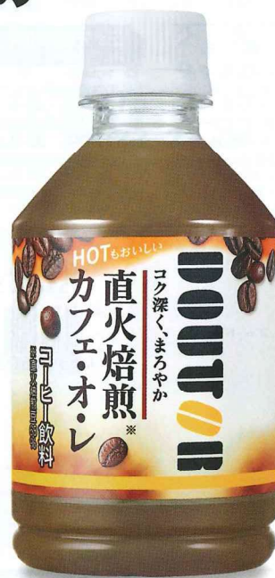
ドトール カフェ・オ・レ PET280ml (ホット&コールド)