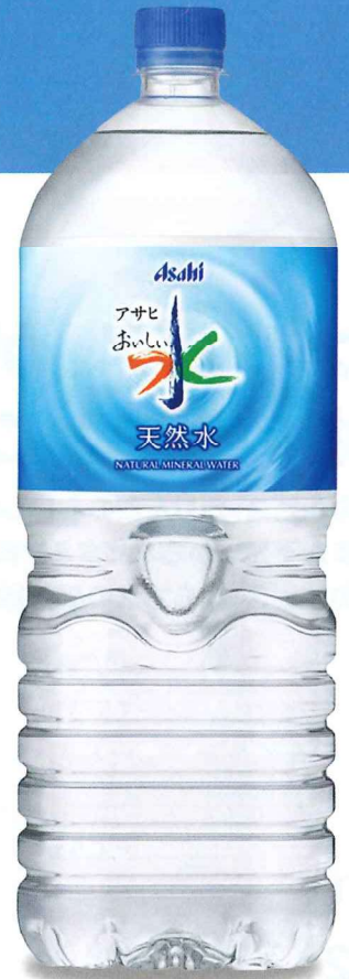
アサヒ おいしい水 天然水 PET2L「9本入」