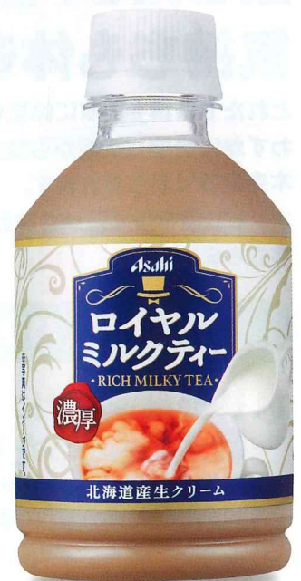
アサヒ ロイヤルミルクティー PET280ml(ホット&コールド)