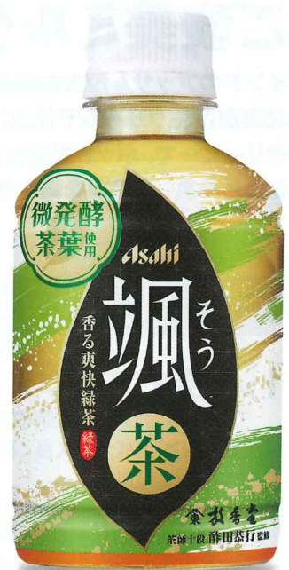
アサヒ 颯 PET275ml(ホット&コールド)