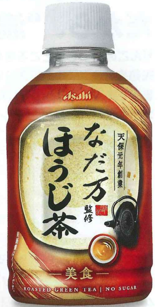
なだ万監修 ほうじ茶 PET275ml(ホット&コールド)