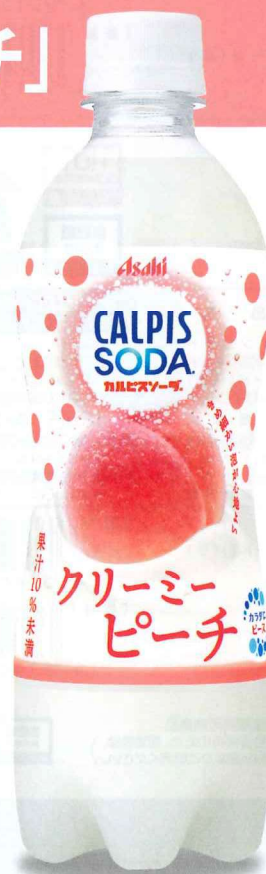
「カルピスソーダ® クリーミーピーチ」 PET500ml